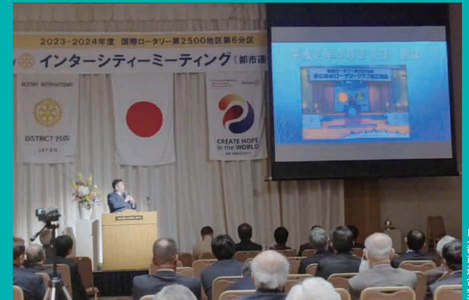
I M (都市連合会)